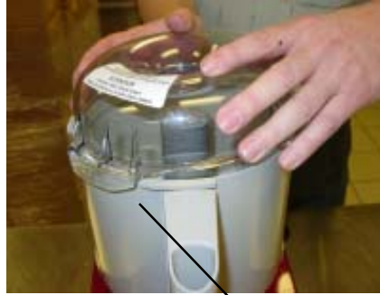
Paso cuatro: Tapa de tazon de lugar en con la etiqueta mas grande en tazon ligeramente a la izquierda