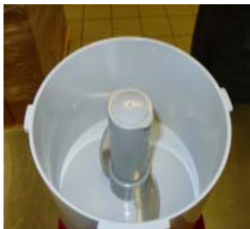
Correctamente reunido S colocacion de lamina