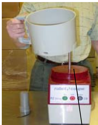
Paso un: El lugar desconcierta el eje de motor colocado con el mango ligeramente a la izquierda.