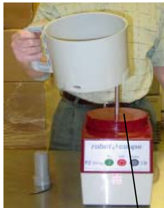
Paso un: El lugar desconcierta el eje de motor colocado con el mango ligeramente a la izquierda.