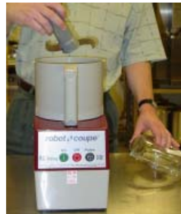
Paso tres: coloque la lamina S en el eje de motor dentro del tazon y gire en sentido contrario al del las agujas del rolog hasta que esta se cierre en el lugar.