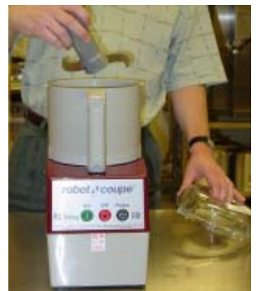
Paso tres: coloque la lamina S en el eje de motor dentro del tazon y gire en sentido contrario al del las agujas del rolog hasta que esta se cierre en el lugar.