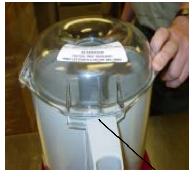
Paso cinco: La torcedura ligeramente en sentido contrario al de las agujas del reloj hasta la etiqueta se desliza en la posicion de cerradura de seguridad. Ahora la unidad puede ser comenzada.