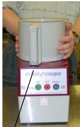
Paso dos: Haga girar el tazon en sentido contrario al de las agujas del reloj hasta que el mango sea centrado en el frente.