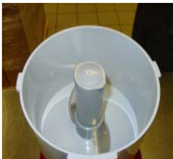
Correctamente reunido S colocacion de lamina