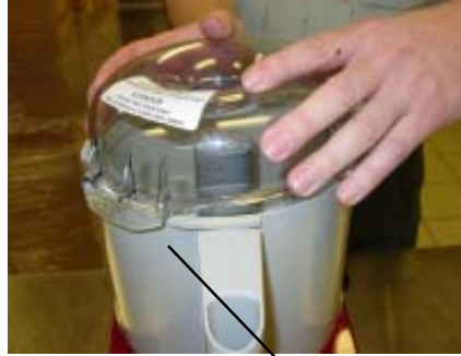
Paso cuatro: Tapa de tazon de lugar en con la etiqueta mas grande en tazon ligeramente a la izquierda