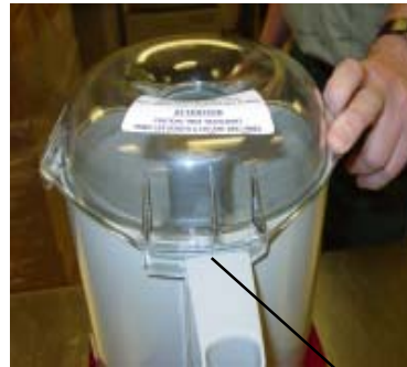
Paso cinco: La torcedura ligeramente en sentido contrario al de las agujas del reloj hasta la etiqueta se desliza en la posicion de cerradura de seguridad. Ahora la unidad puede ser comenzada.