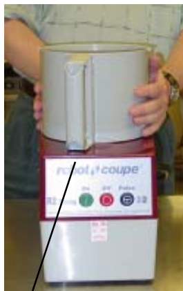
Paso dos: Haga girar el tazon en sentido contrario al de las agujas del reloj hasta que el mango sea centrado en el frente.